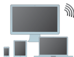
Посредством PC, iPad, iPhone, Android.